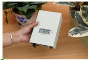
纳米涂料房浓度检测