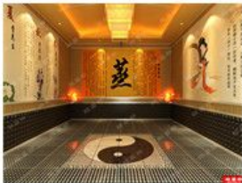
汗蒸房负离子浓度检测