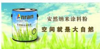
纳米涂料房浓度检测