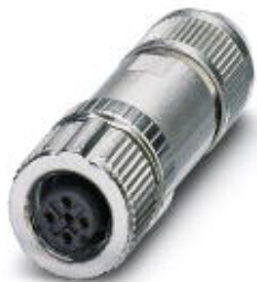
连接器，通用，4-芯，屏蔽，孔式直头 M12，A编码，直插式连接，螺圈材料: 锌铸，镀镍，电缆外径 4 mm ... 8 mm

Please be informed that the data shown in this PDF Document is generated from our Online Catalog. Please find the complete data in the user's documentation. Our General Terms of Use for Downloads are valid ( http://download.phoenixcontact.com )