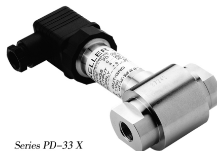
Series PD-33 X