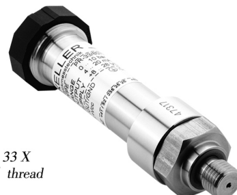
Series 33 X G1/4" thread