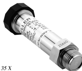
Series 35 X G1/2" flush diaphragm