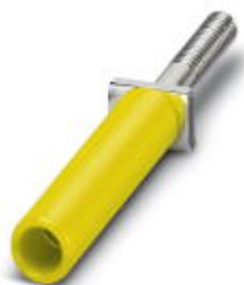
测试孔式连接器，颜色: 黄色

Please be informed that the data shown in this PDF Document is generated from our Online Catalog. Please find the complete data in the user's documentation. Our General Terms of Use for Downloads are valid ( http://download.phoenixcontact.com )